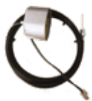
EF 170 Kit elettrofreno completo di cavo e manopola di sblocco per motori RING170