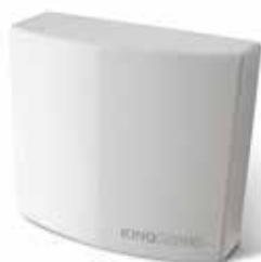
STAR B PLUS Centrale di comando per 1 motore 230 Vac con ricevitore incorporato