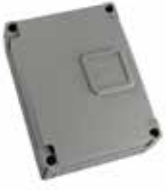
Elbox 33 Robustes Gehäuse aus ABS Kunststoff mit Halterung für Elektronik