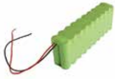
BAT M016 Batterie 24 V 1,6 Ah