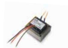
TR 40L Lamellare Transformator 40 VA für STAR8 AC für Drehtore