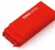
KINGCONNECT Wifi-Modul zur Programmierung der Steuerungen STARG8 mit dem Smartphone