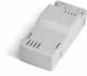
BAT K3 Ladeplatine für Batterie BAT M016