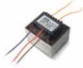
TR 150-12/24 Transformator 150 VA für STAR8 24 (nicht für Minimodus and Dynamos XL)