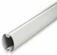
ASO 3000 Slagboom 3 m