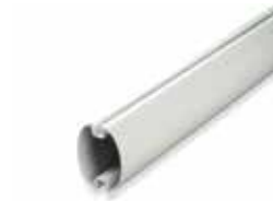
ASO 5000 Slagboom 5 m