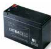
BAT60 Batterij 12 V, 6 Ah (voor de werking zijn twee batterijen nodig)