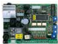
STAR Open Reservebesturingseenheid