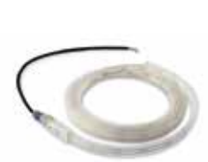
ASOLED6000 Koord van leds voor slagbomen. Lengte 6 m