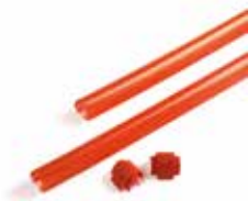
ASORUB Beschermrubber voor slagbomen