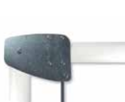
ASOJOINT Scharnierkoppeling voor slagbomen ASO 3000 (1950 mm tot 2400 mm)