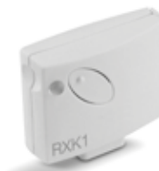
RX K1 Ontvanger met insteekverbinding