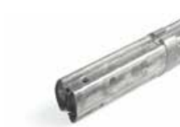
ASOLINK Koppelstuk voor slagbomen compatibel met ASO 3000