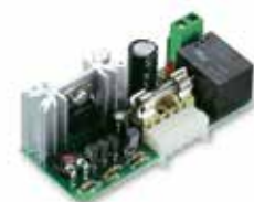
Bat K30 Batterijlader met insteekverbinding