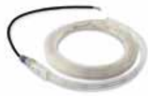
ASOLED4000 Koord van leds voor slagbomen. Lengte 4 m