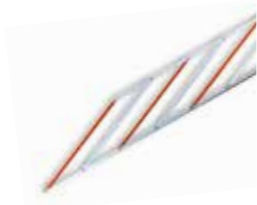
ASOGRID Hekwerk van aluminium (2 m)