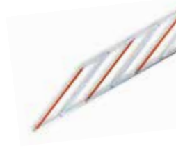
ASOGRID Hekwerk van aluminium (2 m)