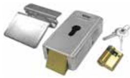
LOCK VE Verticaal elektroslot 12 V