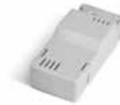
BAT K3 Oplaadkaart voor batterij BAT M016