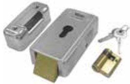
LOCK HO Horizontaal elektroslot 12 V