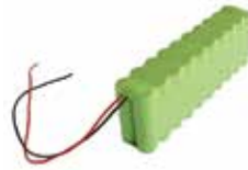
BAT M016 Batterij 24 V 1,6 Ah