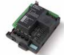
STARG8 24 Reservebesturingseenheid 24 Vdc