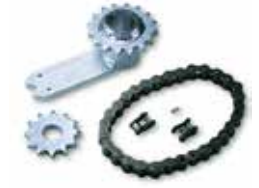
INT 360 Kit para apertura hoja a 360°