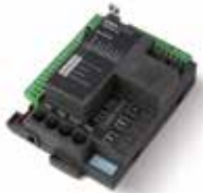
STARG8 AC Centralita de repuesto 230 Vac