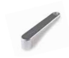
INK Leva de desbloqueo para INTRO LOCK (4 u./paq.)