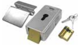
LOCK VE Electrocerradura vertical 12 V