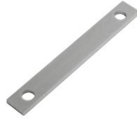
INTRO FR Adaptador para cajas de cimientos