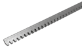
CRIS 400 Tandheugel van verzinkt staal 22x22x1000 mm om te lassen