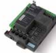
STARG8 AC Reservebesturingseenheid 230 Vac