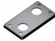
PDY 100 Funderingsplaat voor bevestiging op vloer