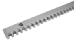
CRIS 200 Tandheugel van verzinkt staal met schroeven en afstandstukken 30x12x1000 mm