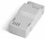
BAT K3 Oplaadkaart voor batterij BAT M016