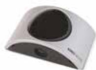
NOVO PH 180