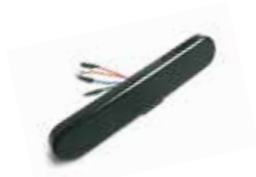
IND 100 Inductieve eindschakelaar