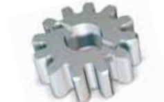
M 600 12-Zähne-Kranz M6, für die Zahnstange CRIS 600