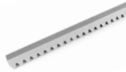
CRIS 600 Zahnstange M6 30x30x1000 mm verzinkt, mit dem Kranz M600 zu paaren