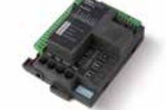
STARG8 AC Ersatzsteuerung 230 V AC