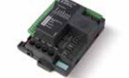
STARG8 24 XL Ersatzsteuerung 24 V DC für Dynamos XL 1800