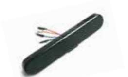
IND 100 Induktiver Endschalter